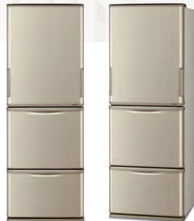
-N マットシャンパン