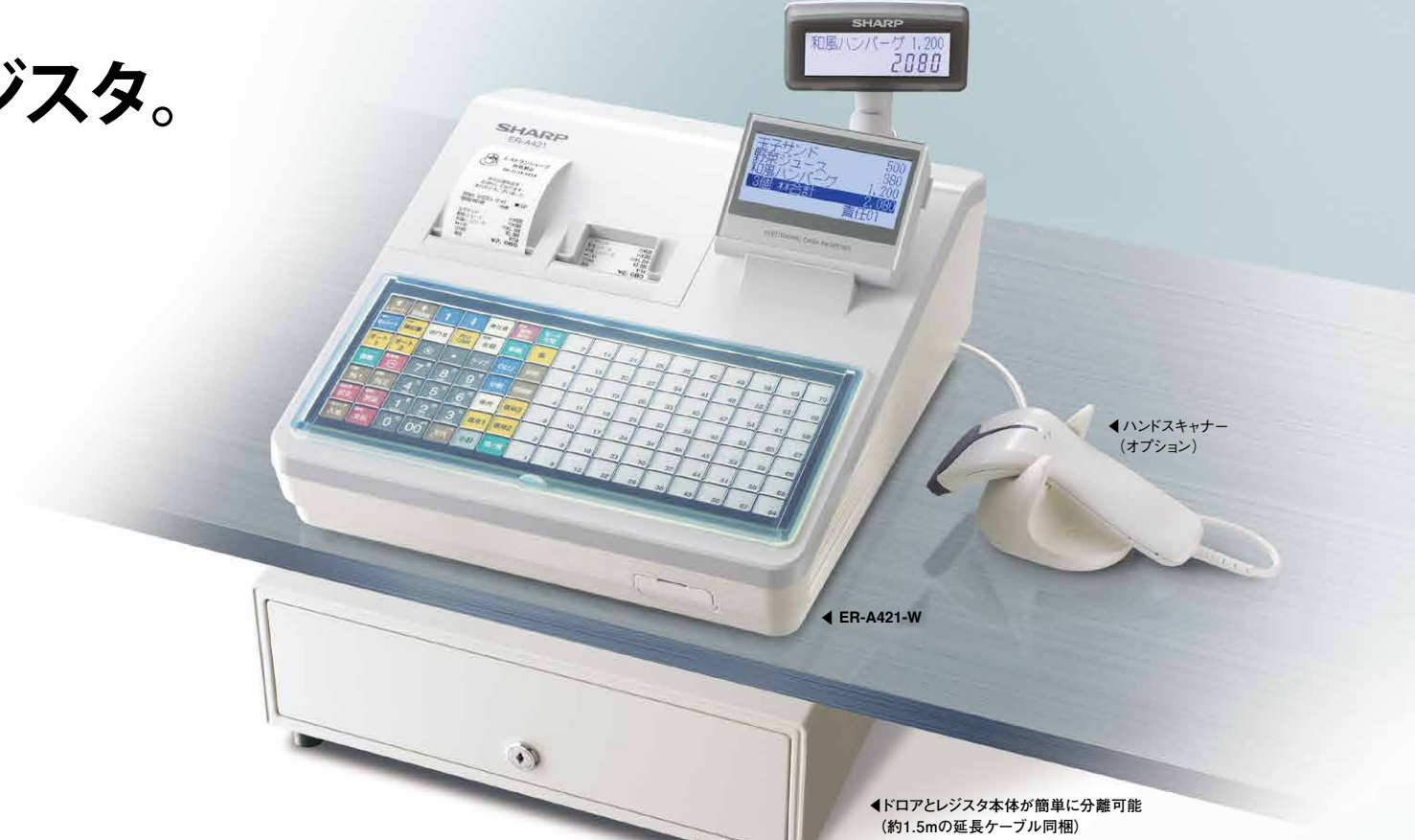
◀ハンズキャナー(オプション)