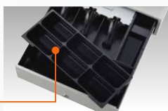
分離型コインケース

スリム設計のドローは場所をとらず、使い勝手の良い3紙幣6硬貨収納タイプです。さらに、同梱の約1.5mの延長ケーブルを使用して、レジスタ本体とドローが分離できる構造になっています。