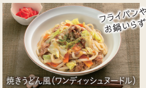
フライパンやお鍋いらず 焼きうどん風(ワンディッシュヌードル)

残りごはんや冷凍ゆでめんがあればお好みの具材を準備するだけ! 後片付けもカンタンです。