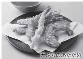
天ぷらのあたため