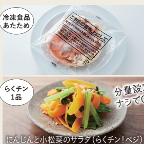
冷凍食品 あたため

食品から発生する蒸気量で食品の状態を検知するので、冷凍食品はワット数・加熱時間を設定せずに自動であたため、らくチン1品は食材のアレンジができます。