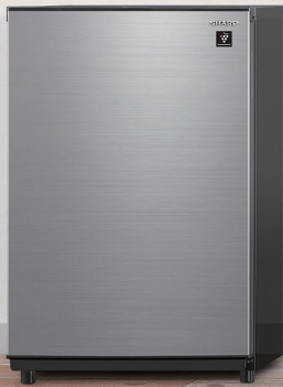
FJ-HM7K-H (メタリックグレー)