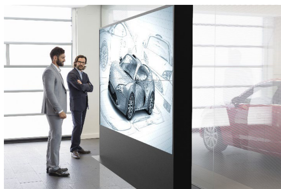
ショールーム Show room