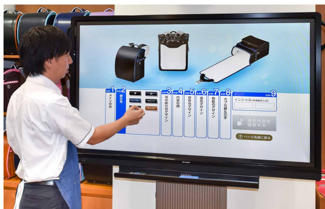
ランドセルのデザインをタッチ操作で選択してオーダーメイド

当社のオンラインショップでは、ランドセルの革の色や細部のデザインなどを自由に選んで注文できるオーダーメイド・ランドセルのシステムを運用しています。これまで展示会や直売会では、このシステムをノートPCやタブレット端末で使って商談してきましたが、小さい画面では複数人で同時に見るのが難しかったり、細かなデザインの細部が判別しづらいという問題点がありました。そこで新店舗オープンに向けて、これらの問題点を解決できるディスプレイの導入を検討することになりました。