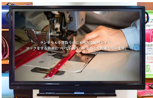
接客の合間には自社工場の映像を映して商品をPR