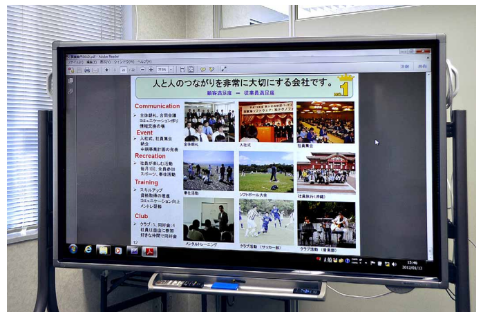
従来のプロジェクターより写真も鮮明に