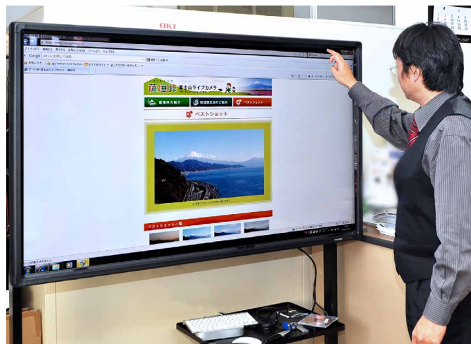
同社が設置した「富士山ライブカメラ」の映像をディスプレイに表示

近年は、スマートフォンやタブレット端末の登場により、人々のタッチパネル操作が一般化し、これからは当たり前になってくる時代だと考えています。そんな中でこうしたタッチディスプレイは大きな可能性を秘めていると思いますので、これを活かしたシステム作りを進めていきます。