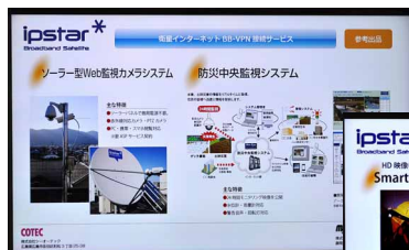
展示会では自社商品のPRツールとして活用