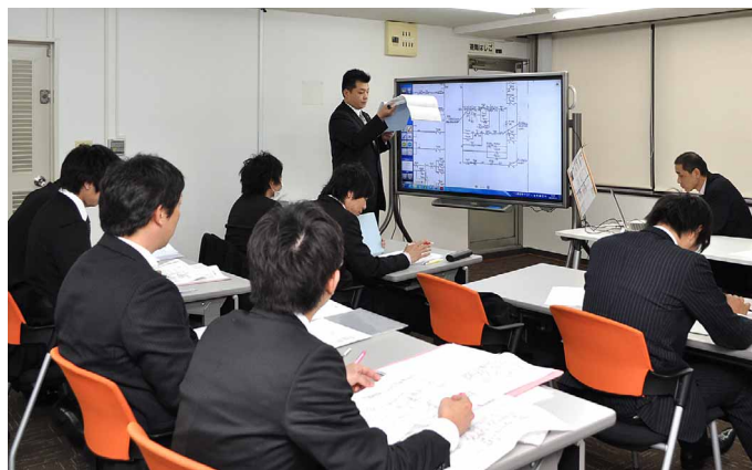
電気系統図、部品写真などあらゆる資料をBIG PADに表示