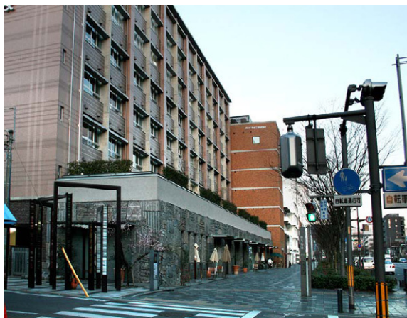
御池通では、景観条例により中学校も1階を商業施設に

本社ビルは条例制定以前の建物なので対象外となっていますが、古都の景観づくりに協力するの地元企業の役割と考えました。そこで、瓦屋根を取り付けたり特注の防火用水桶をディスプレイ周りに演出しました。大画面に映し出される景観写真や観光地図などの映像は御池通のイメージにもマッチしており、当社のイメージアップにもなっています。