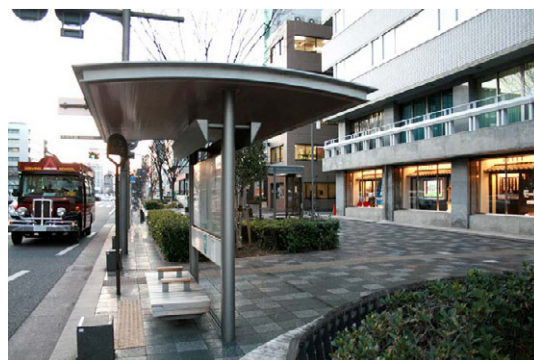
バス停と地下鉄の出入口に面したショールームはよく目立ち、同社の知名度アップに貢献

ディスプレイを覗き込む通行人が増えていることは、当社の知名度アップにもなっているでしょうし、ディテール客へのアプローチという、リニューアルの目的は十分に果たしていると思います。