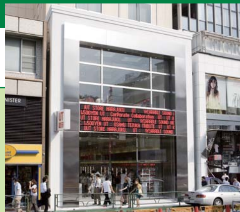
UT STORE HARAJUKU. 東京都渋谷区神宮前 http://ut.uniqlo.com/

ストリートファッションと流行の発信地、原宿にこの春誕生した「UT STORE HARAJUKU.」は、株式会社ユニクロが運営するTシャツ専門店。世界で唯一の「UT」ブランドストアは、Tシャツの新しい売り方、選び方をカタチにした、ユニクロの戦略拠点でもあります。