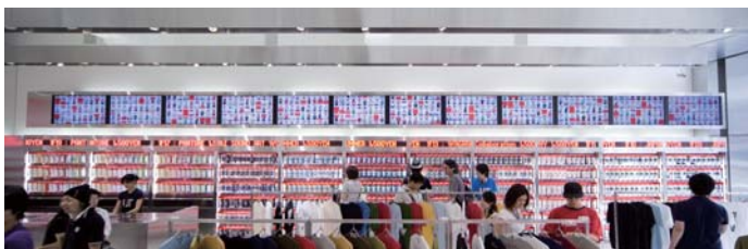
1F入り口から奥へ続く12連結のマルチディスプレイ。空間イメージに合わせて上下にシルバーのフレームを取り付けた。大きな動きのマルチ表示はベゼルをまたいても違和感がない。

赤・白・シルバーを基調にしたスリッドな印象の店内。一方、商品のタグには手書きのコメントが。硬質感と温かさのバランスが新鮮。1~3Fの店舗、4Fギャラリーの総合ディレクションは佐藤可士和さんとのコラボレーションによるもの。