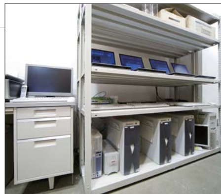
5FにあるPCルーム。3台のPCで各4台ずつの「PN-465」にLANを通じてコンテンツを配信している。コントロールは専用ソフトで。

表示に対応できる機種は限られます。2機種に絞り込み、最終的には、明るい店内の照明に影響されず、どこからでも綺麗で見やすいインフォメーションディスプレイに決めました。」1階に設置したディスプレイを、5階のPCルームから制御する条件もなんなくクリア。何度となくテストを重ね、12画面の映像がスムーズに同期するプログラムも完成。トップクリエイターの英知と彼らの眼鏡にかなうディスプレイがでて、他に例を見ない映像プロモーションが実現しました。