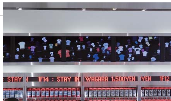
コンテンツはここでしか見られないオリジナル。縦のスピーディなスクロール、4画面をスムーズにつないでいく横への流れと、動きにも特徴がある。

の声も聞かれますし、TシャツへのこだわりやUTの世界観を受け取ってもらえていると思います。これまでのユニクロの店舗とは違う、商品展開、新しさ、おもしろさが歓迎され、スタッフの励みにもなっています。」