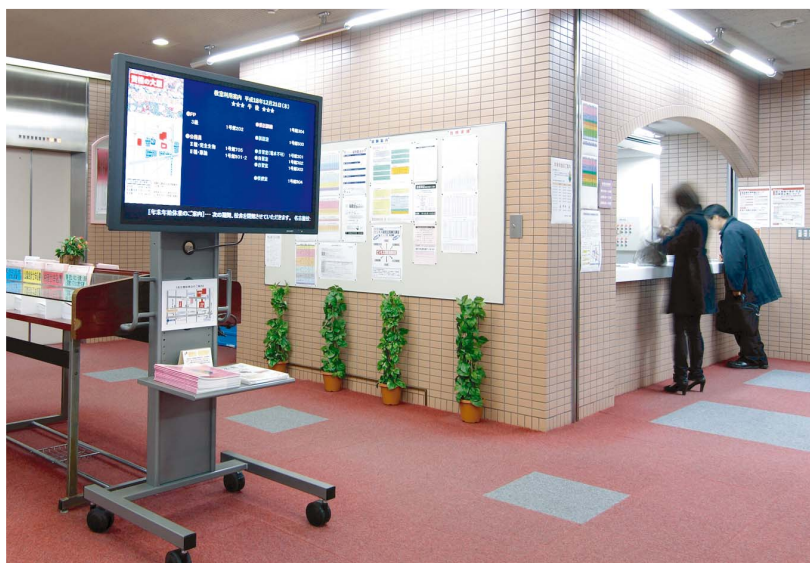
名古屋校1号館のエントランスに導入された『PN-455C』。1号館は名古屋校の本部としての役割を持ち、多くのお客様も来館される。

JR名古屋駅からも、地下鉄国際センター駅からも徒歩圏内。学校法人名古屋大原学園様の名古屋校は、アクセスに恵まれた絶好のロケーションにあります。名古屋校には、大原簿記専門学校、大原法律専門学校、大原トラベル・ホテル専門学校の3校があり、約1,200名(2007年1月現在)の学生が将来の夢に向かってチャレンジ中。それに加えて、夜間や土曜日・日曜日の授業には社会人や大学生が出席し、それぞれのキャリアアップをめざし専門知識の修得に励んでいます。そんな名古屋校の1号館に導入された、『PN-455C』。エントランスで、1日の授業内容とその教室番号が表示されています。