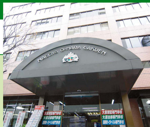
所在地:愛知県名古屋市

学校法人大原学園グループとして、名古屋市内と浜松市内にそれぞれ3校、静岡市内に4校の専門学校を持つ、学校法人名古屋大原学園様。各分野に分かれた細やかなカリキュラムのもと、多彩な専門授業と資格試験へのフォローアップで、優秀な学生たちを社会に送り出されています。