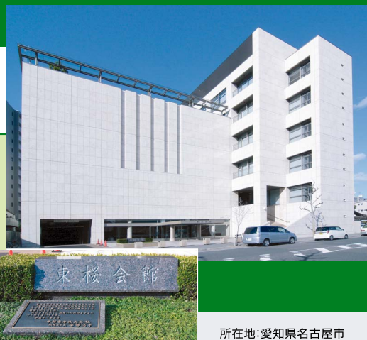
所在地:愛知県名古屋市

東桜会館様は、会議室や集会室、ギャラリー、体育館を備えた地域開放施設です。立地環境は、地下鉄の最寄り駅から徒歩5分。オフィス街の近くでありながら、古くからの寺社が点在する歴史ある町並みの中にあります。平成13年の開館以来、地域の方々の交流の場として、多彩なイベントに活用されています。