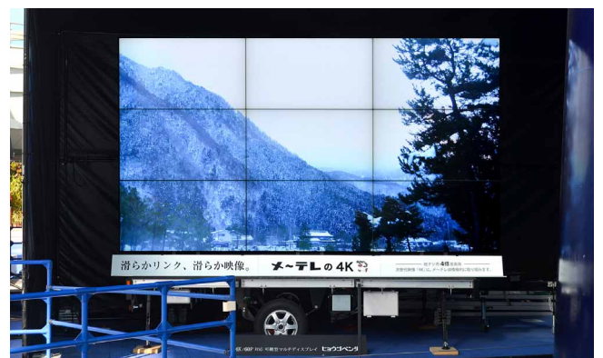
イベント会場において9台のディスプレイを専用トレーラー上に組み立て。屋外・屋内ともに搬入後1時間程度で設置できる

その他、市民マラソン大会や学園祭、自動車関連技術の研究発表会など、可搬性を活かして様々なイベントに参加しており、今後も地域活性化を目指して活動を継続するとともに、4K映像の普及にも尽力していきたいと思っております。また、こういった新規事業への取り組みを、若い社員の育成や新たな人材の確保にもつなげていきたいと考えています。