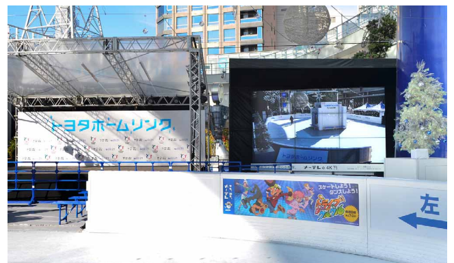
明るい屋外のスケートリンクでも見やすい、高輝度の大大画面マルチディスプレイ