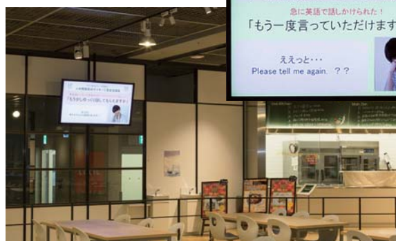
社員食堂に設置された70V型インフォメーションディスプレイ 人気コンテンツの「ビジネスに役立つ英会話」