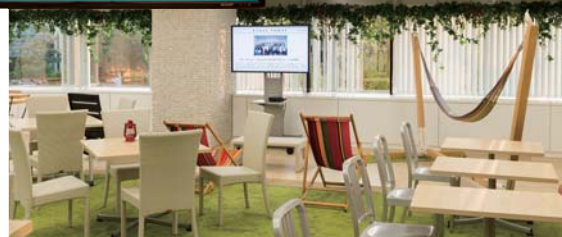
5階のリフレッシュエリアに設置されている 52V型のインフォメーションディスプレイ