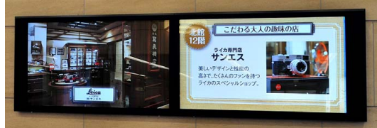
集客を増やしたい上層フロアの情報発信力をアップ