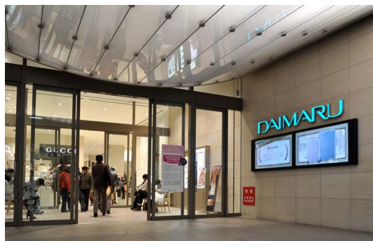
1階・心齋橋筋側エントランス

こうした中、新しい広告媒体として商業施設への設置が進むインフォメーションディスプレイには「次の時代の広告」という期待感があり、新生大丸にふさわしい広告媒体と目を付けたのです。高精細な画質とマルチディスプレイによる迫力ある大画面で、通行客に「大丸の今」をダイレクトに訴求できるのではないかと考え導入を決めました。