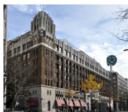
▲大丸 大阪・心齋橋店