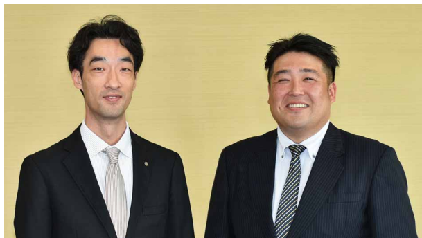
大阪ターミナルビル株式会社