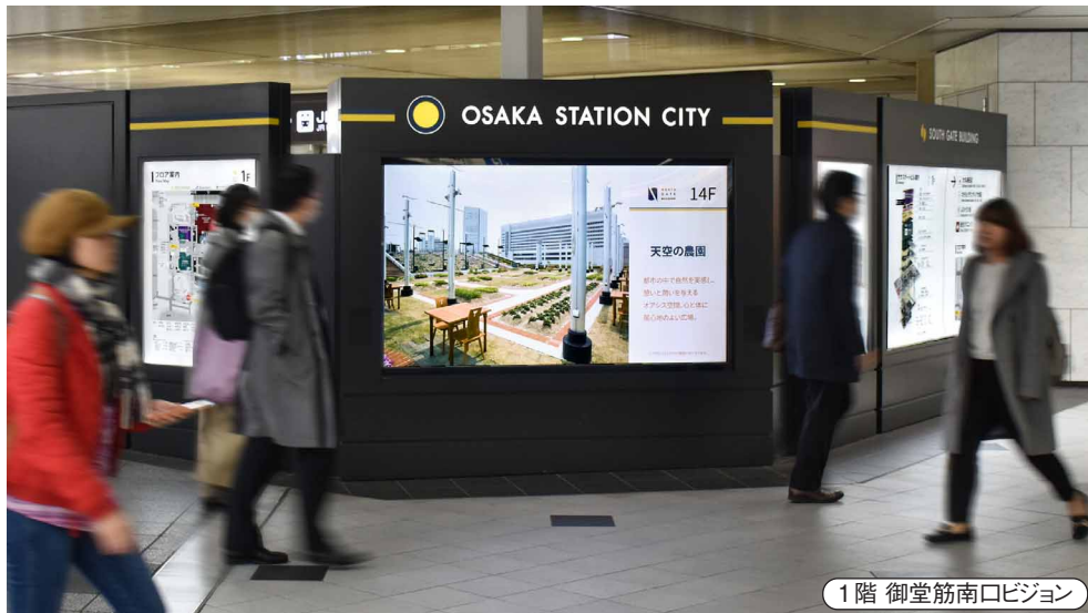
1階 御堂筋南ロビゾン