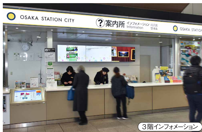
3階インフォメーション カウンター奥に55V型3面マルチディスプレイを設置

2025年には大阪万博が控え、梅田エリアの開発もさらに進展していく見込みです。これに伴い、当施設の利用者数も今後ますます増加することが予想されます。大阪の玄関口として、利用者の新しい発見と感動につながる情報発信を一層強化するとともに、デジタルサイネージを使った誘導などさらなる機能向上、一層のバリアフリー化を図っていきたいと思います。