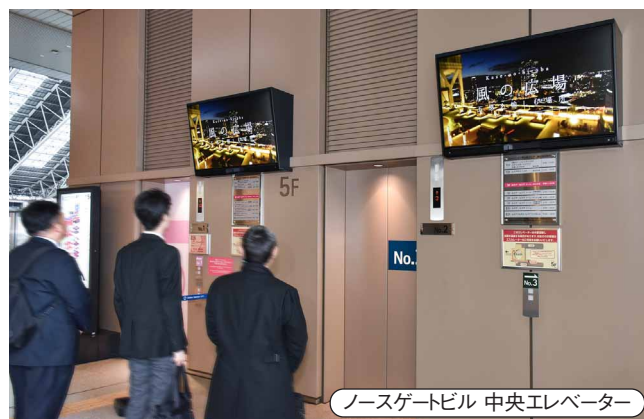
ノースゲートビル 中央エレベーター エレベーターの待ち時間にもディスプレイで情報発信