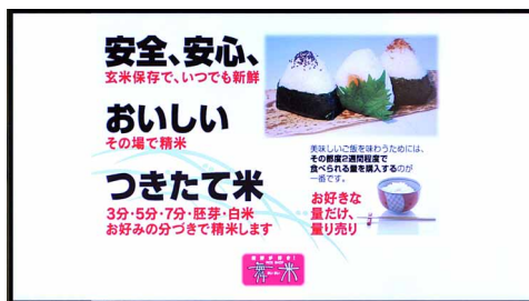
入居するテナント9店の広告を配信