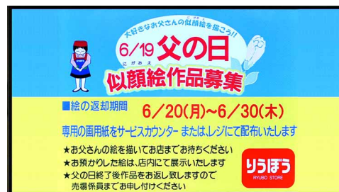
期間限定のお知らせ情報も