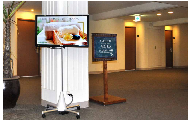
1、2階のエレベーター前ではスパ情報など

今回の設置箇所は、フロント、エレベーター前などでしたが、今後は、スパの施設や当ホテルこだわりのパンショップにも設置予定です。鮮やかなディスプレイで、これからもホテルを華やかに盛り上げていきたいですね。