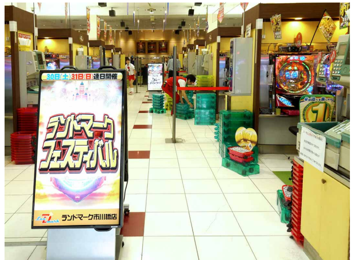
通路に2台の42v型ディスプレイを背中合わせにして5箇所設置

現在、ディスプレイを導入した店舗は5ホール中、2ホールですが、今後は全ホールに導入していければと考えています。また、将来的には、マルチディスプレイの導入も視野に、より大画面で訴求力のある情報発信で、一層のリピーター増加につなげたいと思っています。