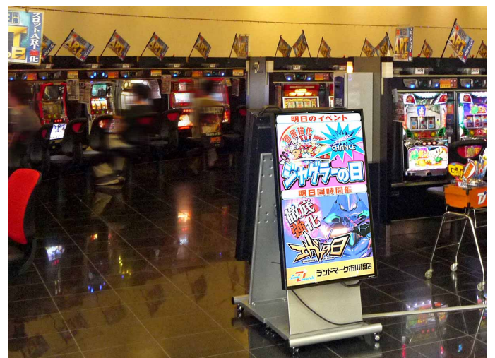
スロットコーナー