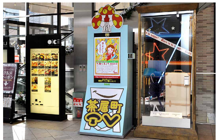
NU茶屋町 1Fエスカレータ前