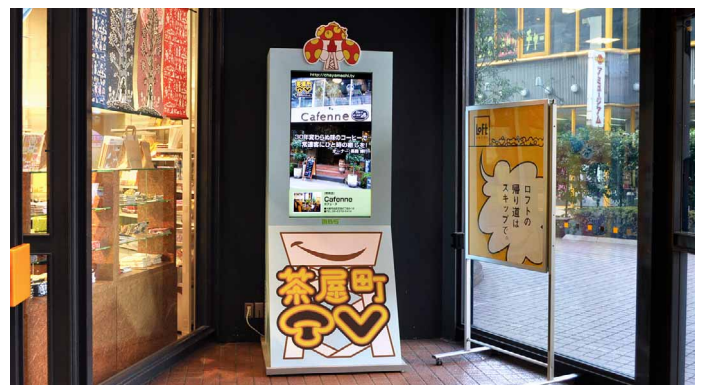
梅田ロフト エントランス