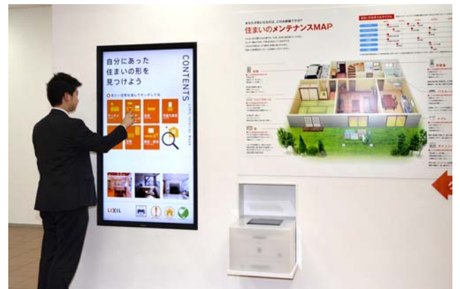
家づくりのヒントや手順、近隣の工務店が検索可能

現在、全国のLIXILショールームで同様のシステムを順次導入していますが、魅力的なコンテンツをさらに充実させることで、より多くのお客さまの住まいづくりに関する疑問にお答えし、様々なご提案を実現したいと考えています。