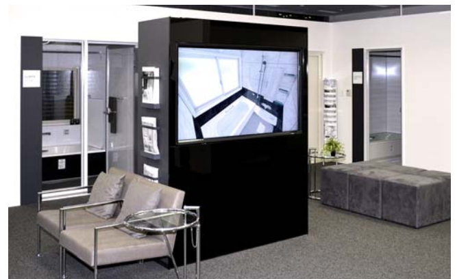
浴室シミュレーションシステムを正確な色再現で高精細表示