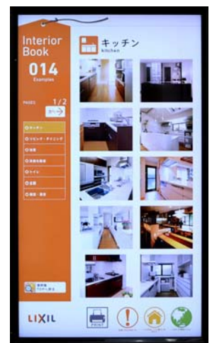
タッチディスプレイで実現した施工事例の写真検索が人気