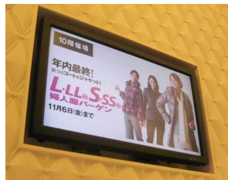
催しなどのお知らせをタイムリーに表示しています。