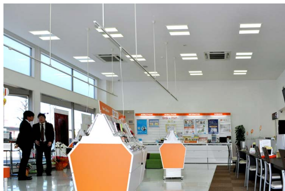
受付カウンターを明るくするため、LED照明がカウンターの真上に来るように設計

LED照明の導入で、明るく開放感のあるエコ店舗づくりに成功したので、今後は、岩通東北で運営する他のauショップ2店舗についても、順次LED照明を導入していく方針です。