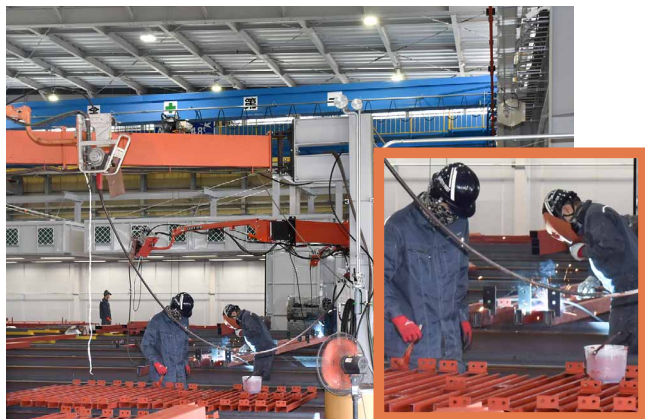
明るく見やすいので、軽微な加工等の作業が安全に行える