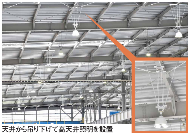
天井から吊り下げて高天井照明を設置