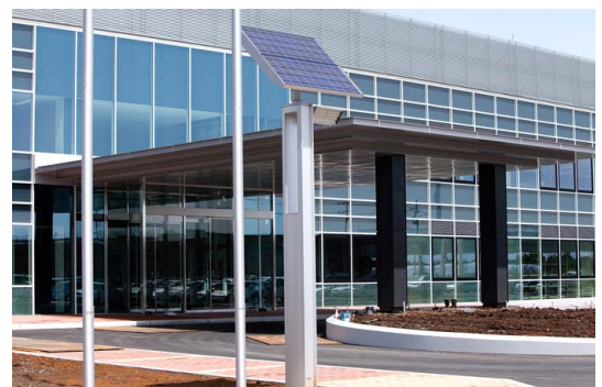
工場正門・正面玄関に設置されたソーラー・LED照明灯