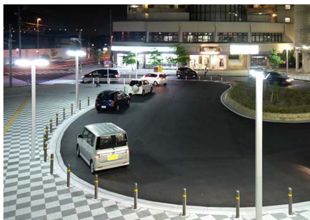
高輝度なLED照明灯で夜間も均一に明るい