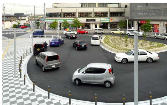
終日、多くの車が行き交う南口ロータリー付近

環境負荷の少ない先進的な技術の普及を後押ししていくことも行政の役割のひとつであると考えます。今後は、安全安心なまちづくりを進めるなかで、災害時の避難場所に指定されている公園等の整備に、ソーラー・LED照明灯等の省エネ機器の活用が必要になってくると考えています。