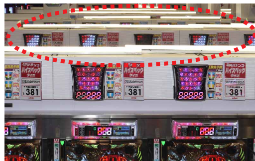
ゲーム台の上には省エネ性に優れたモジュール型ベース照明