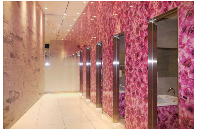
トイレの天井には壁面を効果的に演出するユニバーサルダウンライト

現在、19店舗のうち15店舗にLED照明を導入していますが、今後は各店のLED化率100%を目指すと同時に、残る4店舗にも導入を検討していきます。また、空調ダクト収納型プラズマクラスターイオン発生ユニットシステムを採用している店舗も多く、エコ&快適店舗づくりに向けてシャープ商品の活用を一層進めたいと考えています。