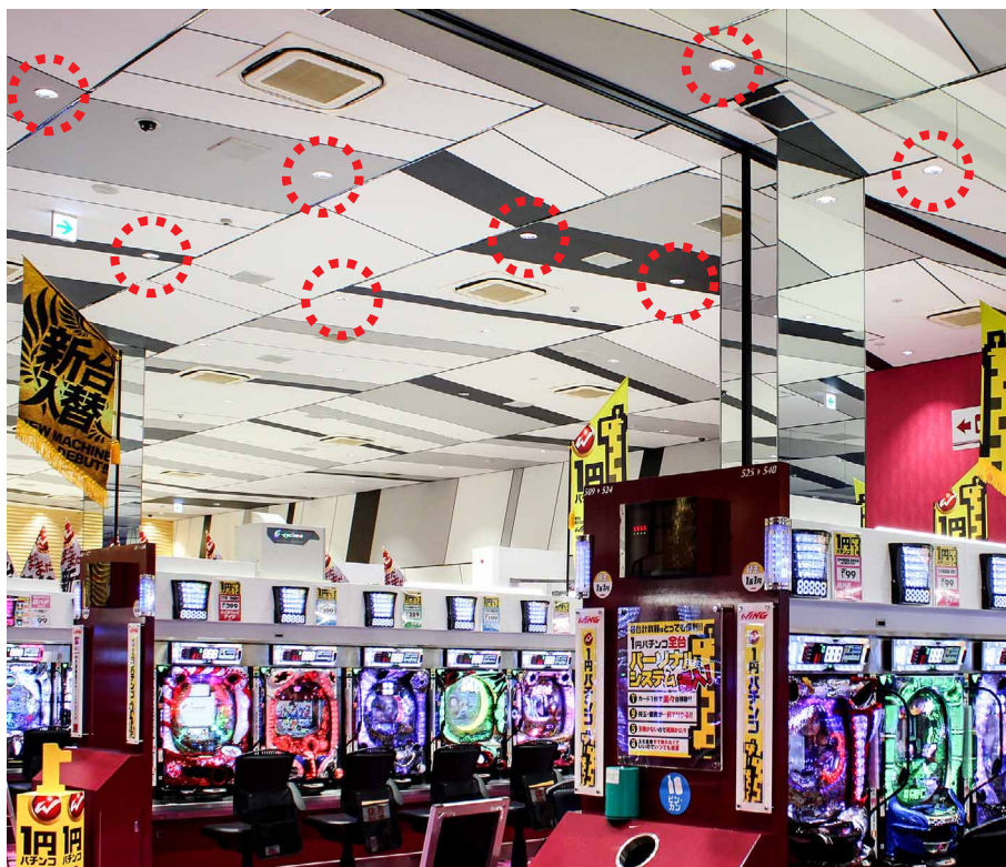
ホールにはひと粒タイプのベースダウンライトDL-D056Wを313台設置