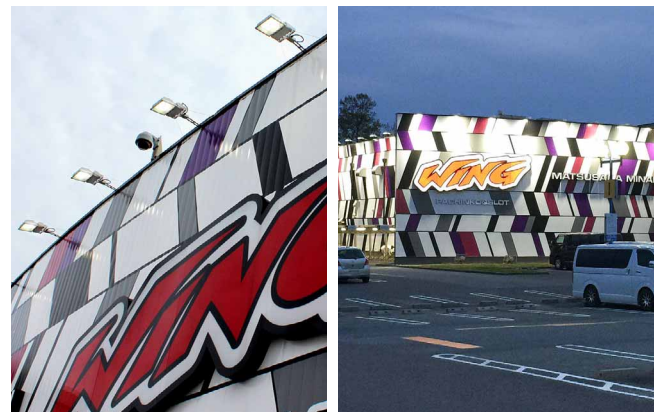
建物のライトアップには本体がアルミダイカストの投光器を設置