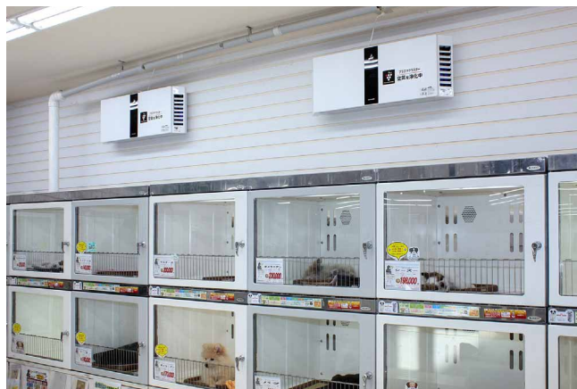
お客さまのショッピングの妨げにならないように壁掛け設置できる機種を採用