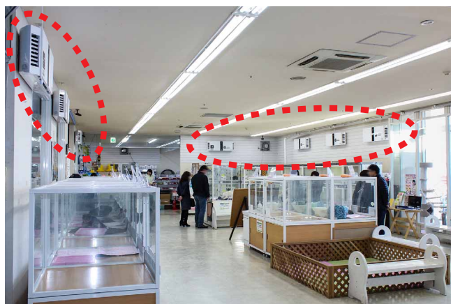
ぐるりと囲むように壁掛けタイプの空気清浄機を計8台設置

当社グループでは今後も各店舗それぞれの状況を見ながら、未設置店への追加導入も検討して参ります。また、当店においては犬猫コーナーでのニオイ抑制効果を実感できたので、今後は鳥コーナーや小動物コーナーへの導入も検討していきたいと考えています。