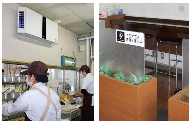
プラズマクラスターのステッカーでも導入をアピール (矢巾店)