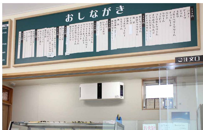
カウンター越しに見える機器が衛生対策のシンボルに (厨川店)