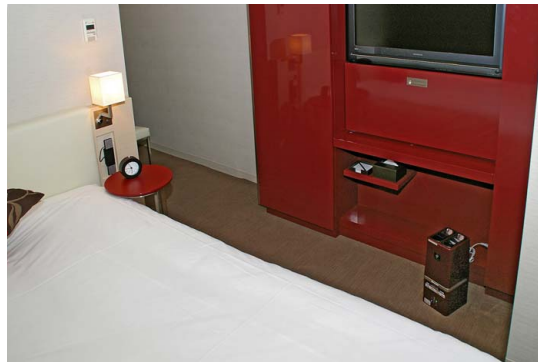
シングル・ルーム。ビジュアル重視のインテリアに溶け込む、デザインやカラーにも満足

そうしたコンセプトの中で、空気の質にも着目し、ホテル業にとって課題である空気の衛生、ニオイ、ハウスダストなどに対して、ワンランク上の対策を講じることにしました。