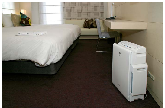
ツイン・ルーム。アレル物質に配慮した人工羽毛のベッドと、プラズマクラスターが相乗効果を発揮