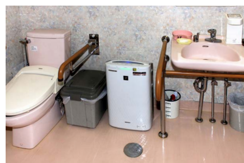
共用トイレには加湿空気清浄機