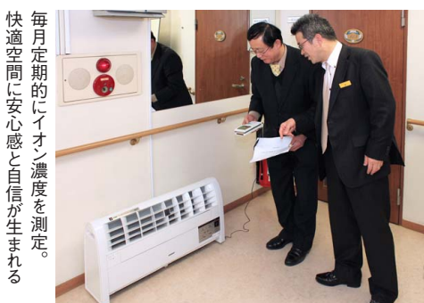
毎月定期的にイオン濃度を測定。 快適空間に安心感と自信が生まれる