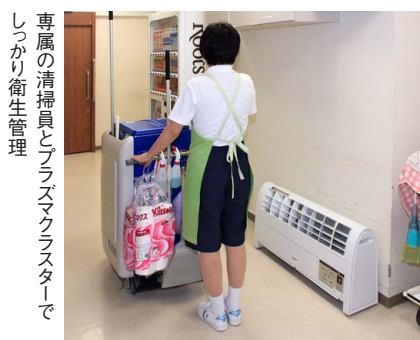
専属の清掃員とプラズマクラスターで しっかり衛生管理