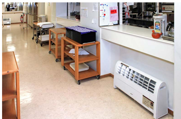
厨房前でも衛生管理と消臭で活躍

大型のイオン発生機を玄関のエレベーター前に設置したことで、当館の衛生対策のPR効果も発揮しています。また、入館者に高濃度のイオンのシャワーを浴びていただくことにもなります。こうしたプラズマクラスターのメリットは社内でも評判になり、徐々にグループ全体に導入が広がっています。