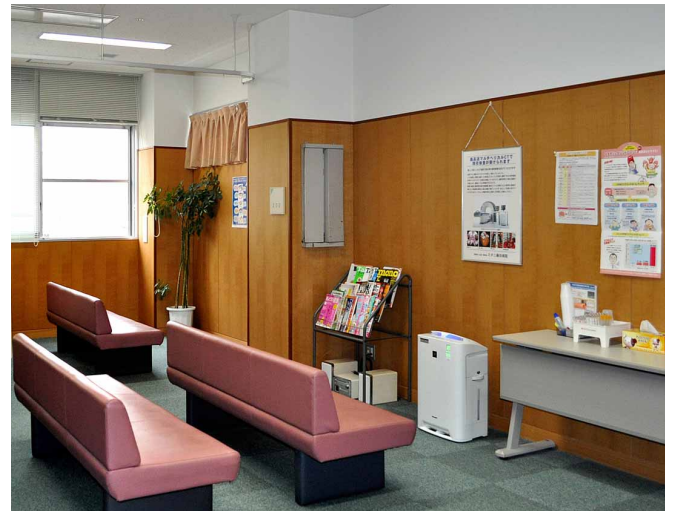
人間ドック室 (待合室)

スタッフルームへの導入で、今後、職員の健康管理への効果も期待しています。一方、当院は老人保健施設を隣接しており、今後こうしたグループ施設にも順次導入を進めていく考えです。