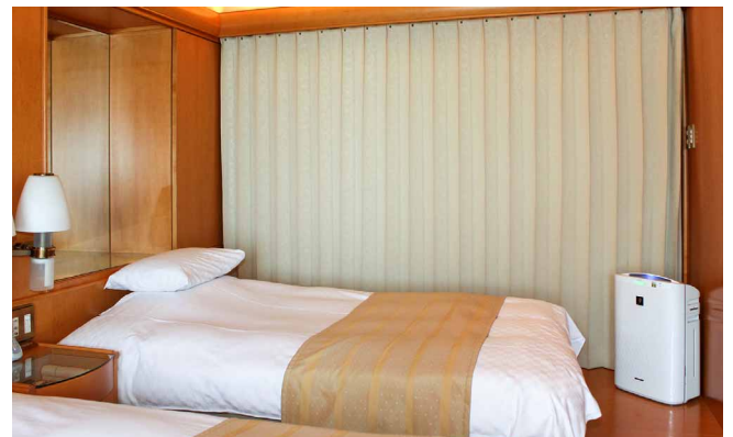
夜お休みの時に客室係が寝室に運ばせていただくことも