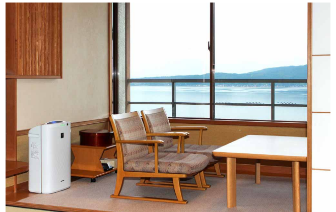
外の景色を楽しみながらゆったりと寛げる場所に設置