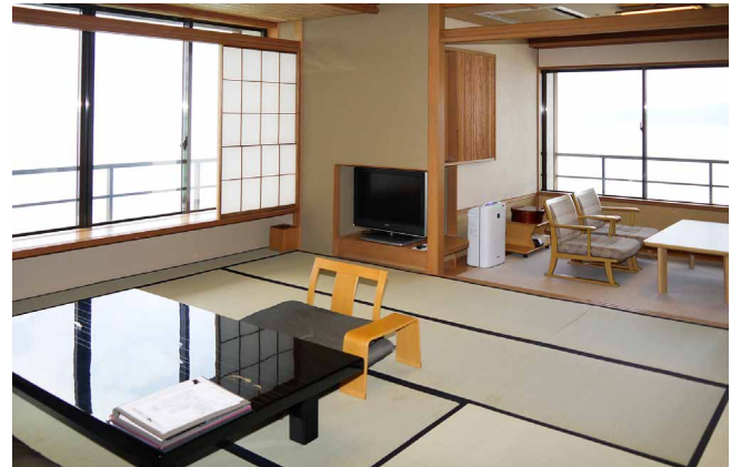
輪島塗の座卓が映える「能登渚亭」の松の六・1216号室

当旅館では、客室係がお客さまをお迎えする前に当日担当する客室を点検しています。そういった現場のスタッフから「客室の空気がキレイで気持ちが良い、自宅用にも購入したい」という声が多く寄せられています。今後は、スタッフの感想を反映させ、より多くの宴会場や厨房などへプラズマクラスター搭載商品の導入を検討していきたいと考えています。