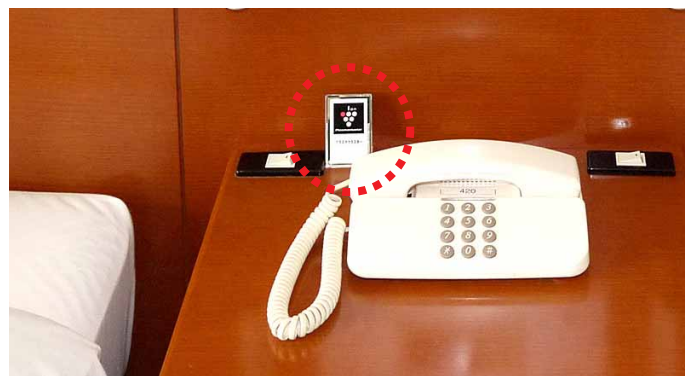
ベッドサイドにプラズマクラスター設置をPRするプレート