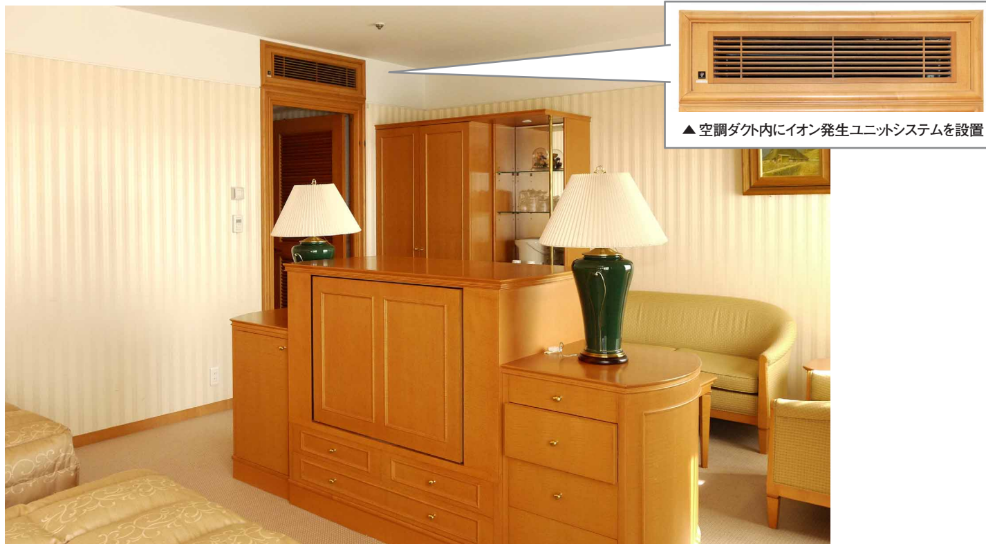
▲空調ダクト内にイオン発生ユニットシステムを設置