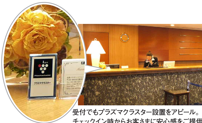
受付でもプラズマクラスター設置をアピール。チェックイン時からお客さまに安心感をご提供