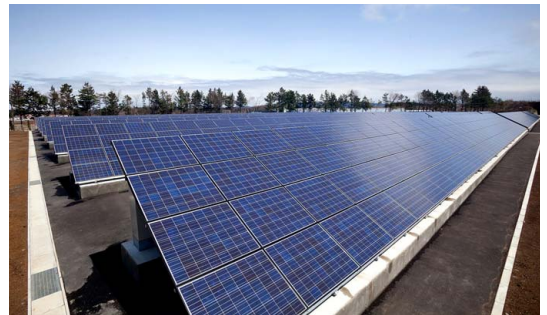
工場の広い敷地を活用し、地上にも太陽光パネルを大規模に導入