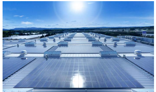
工場の屋根一面に太陽光パネル。発電だけでなく遮熱効果も高い

また、地域社会の注目度も高く、地元小学校や取引先企業からの工場見学申し込みが相次いでおり、イメージアップ効果にも期待が膨らんでいます。