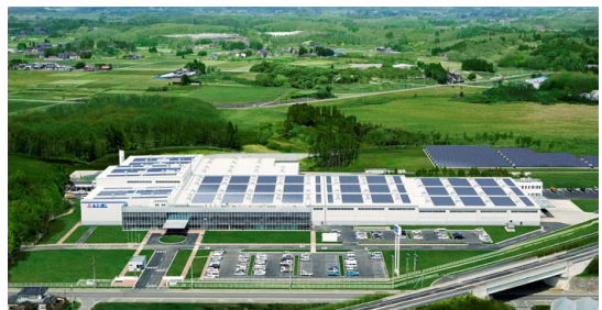
福島矢吹工場の全景。工場屋根と右奥の敷地に敷き詰められた太陽光パネルの様子がよくわかる