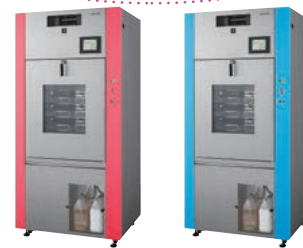
(ピンク系) (ブルー系)