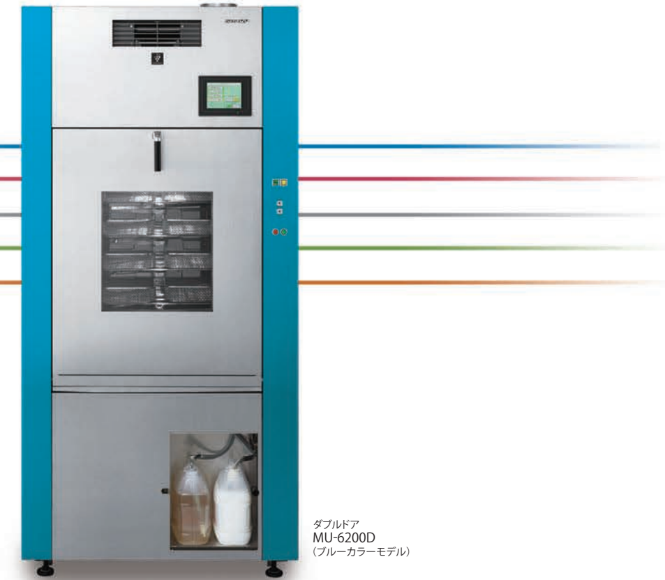
ダブルドア MU-6200D (ブルーカラーモデル)

●製品改良のため、仕様の一部を予告なく変更することがあります。また、商品の色調は印刷のため実物と異なる場合がありますので、あらかじめご了承ください。●表示部は、ハメコミ合成で実際の表示とは色調など若干異なります。●当カタログに掲載された機種の中には、品切れになるものもありますので、販売店にお確かめのうえ、お選びください。●本カタログ掲載の製品には、警告表示ラベルのあるものもありますので、ご注意ください。