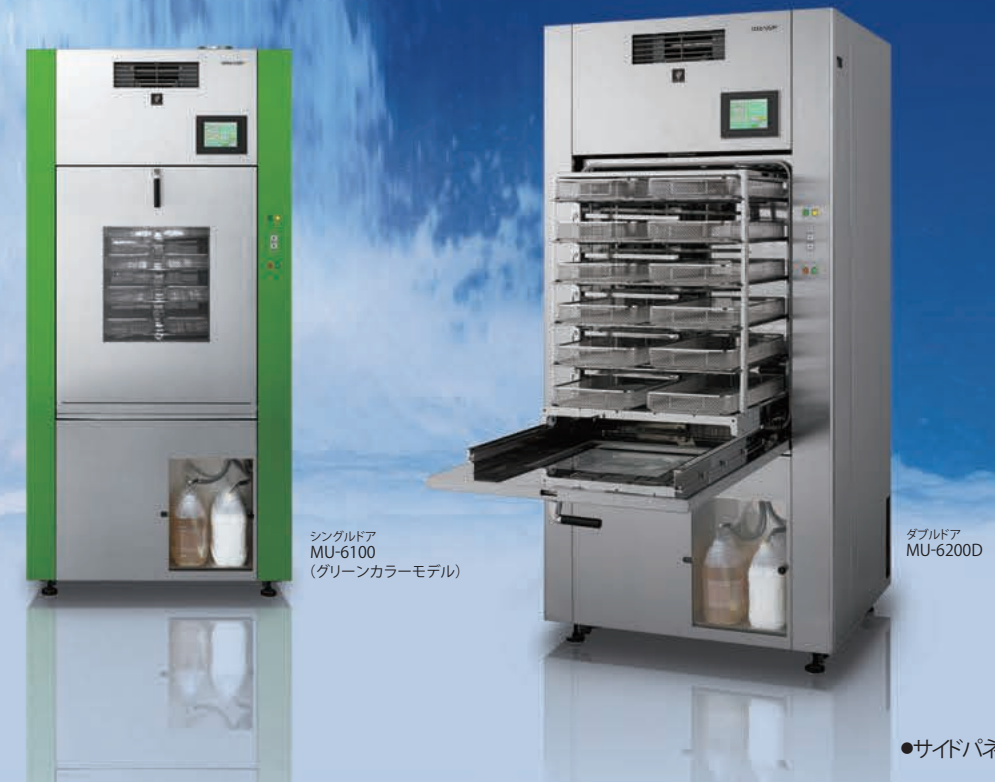
シングルドア MU-6100 (グリーンカラーモデル)