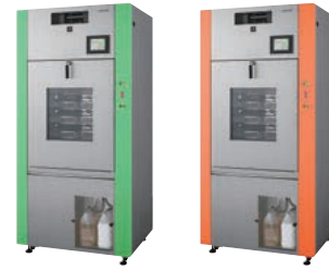
(グリーン系) (オレンジ系)