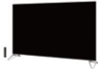
8K相当の表示を可能にする 4K液晶テレビ “AQUOS 4K NEXT”