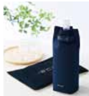
「適温」を長時間持続する クーラーバッグ “TEKION COOLER”