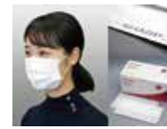
社会貢献として生産開始 不織布マスク