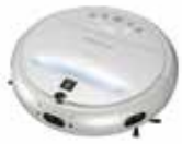
お部屋をキレイにする ロボット家電“COCOROBO”