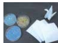
目標湿度に調節・維持する調湿材 “TEKIJUN(適潤)”