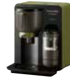
お茶メーカー “ヘルシオお茶プレス”