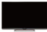
4K対応液晶テレビ “AQUOS 4K”