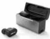
耳あな型補聴器 メディカルリスニングプラグ