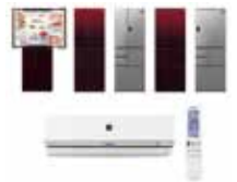
AIoTプラットフォームを活用した サービスを実用化 AloTクラウドサービス対応製品