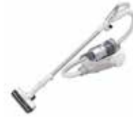
コードレスキャニスター掃除機 “RACTIVE Air(ラクティブ エア)”