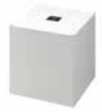
クラウド蓄電池システム