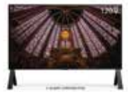
業界最大級を実現した 120V型8Kディスプレイ