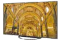
新4K8K衛星放送対応 8Kチューナー内蔵液晶テレビ “AQUOS 8K”