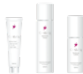
医薬部外品のスキンケアアイテム “薬用Crystalia(クリスタリーク)”