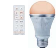
省エネ・長寿命・水銀レスと、 環境性能に優れたLED電球