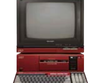
世界初、テレビとパソコンを 一体化した「パソコンテレビX1」