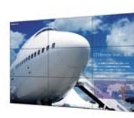
当時、世界最狭のシステム・フレーム 幅6.5mmのマルチディスプレイシステム