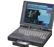
高解像度TFTカラー液晶大画面の ノートパソコン「メビウスノート」