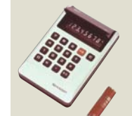
世界初、液晶表示ボケツケル 電卓「液晶コンペット」