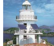
当時、世界最大の出力225Wの 太陽電池を設置した御神島灯台