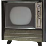
カラーテレビを量産