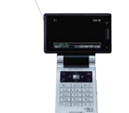
ディスプレイが回転するワンセグ放送 対応携帯電話(ボータフォン向け)