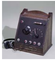
国産第1号鉱石ラジオ