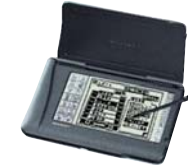
ビジネスに必要な道具を一台に 凝縮した新携帯情報ツール 液晶ペンコム「ザウルス」