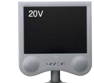
21世紀の液晶カラーテレビ 「アコス」