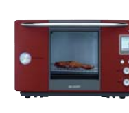
水で焼く新発想の調理器、 ウォーターオープン「ヘルシオ」