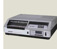
フロントローディング採用。 初の15万円台を実現した 「マイビデオV3」