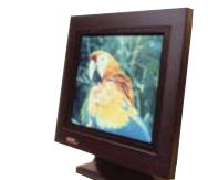
世界初、薄型・大画面の14型 TFTカラー液晶ディスプレイを開発