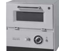
日本初、ターンテーブル式 家庭用電子レンジ