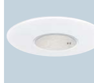
業界初、LEDシーリングライト 「エルム」