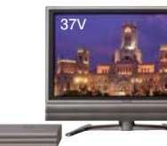
315万画素ハイビジョン液晶テレビ (亀山工場生産第1号)「アコス」