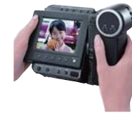
画面を見ながら撮れる、撮った映像を その場で楽しめる、「液晶ビューカム」