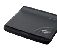
当時、世界最薄の 家庭用ファクシミリ「イラストーク」