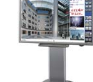
80V型タッチディスプレイ 「ビッグパッド」