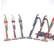
ゴミと空気を遠心分離、排気が クリーンなサイクロン掃除機