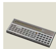
コンピュータ言語BASICが使える ポケットコンピュータ