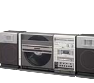
世界初、 レコード面自動演奏ステレオ