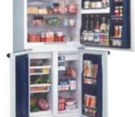
よく使う冷蔵庫を上にした、 ワークトップ冷蔵庫