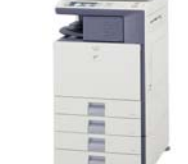
マイクロスター採用のデジタル フルカラー複合機