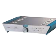
世界初、2.8MHzの高速サンプリング ／7次デルタシグマ変調方式の、 1ビットアンプ