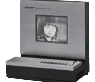
高輝度、長寿命の薄膜EL素子 でテレビ映像再生に成功 (写真は1977年のもの)