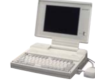
業界最小、最軽量のノートタイプの 英日機械翻訳システム「Duet Qi」