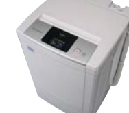
脱水槽に穴がない「むだ水セーブ」で、 水・洗剤を大幅に節約する全自動洗濯機