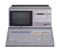
クリーンコンピュータ「M2」