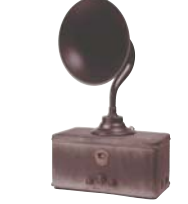
交流式真空管ラジオ 「シャープダイナ」