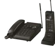
業界初、小電力コードレス留守番 電話機