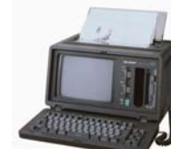
AI辞書搭載の新連文変換 採用のパーソナルワープロ