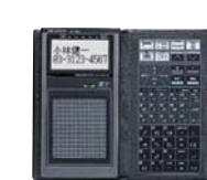
漢字が使える、電子システム手帳