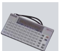
日本語・英語を相互翻訳できる、 ポケット電訳機