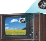
裏番組も同時に見られる2画面 の、テレビ・イン・テレビ