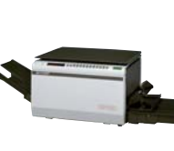
当時、世界最小・最軽量の PPC複写機