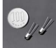
近赤外光と可視光を同時に 放射する、ダブル発光ダイオード