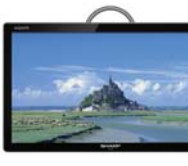
コンパクトで持ち運べる 「フリースタイル アコス」