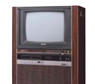
カラーテレビとビデオを一体化した、 ビデオテレビ