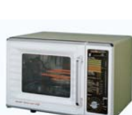
世界初、お料理を自動的に仕上げる センサーオーブンレンジ