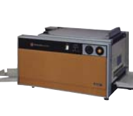
IC制御回路を採用した PPC複写機