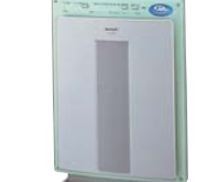
世界初、プラスとマイナスのイオンで 浮遊する菌などを空中で分解・除去する、 プラスマクラスター空気清浄機