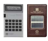
初の太陽電池採用電卓