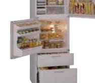
業界初、同じドアが右からも 左からも開く、左右開き冷蔵庫