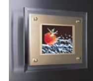
業界初、8.6型夢の壁掛けテレビ 「液晶ミュージアム」