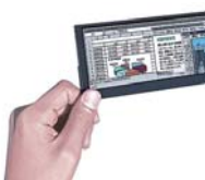
バックライト不要、明るい屋外でも 鮮やかなカラー表示ができる高反射 型液晶(スーパーモバイル液晶)