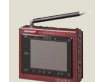
TFT方式の3型液晶カラーテレビ 「クリスタルロン」