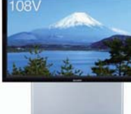
当時、世界最大の業務用 108V型液晶ディスプレイ