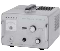
大型時計も丸洗いできる 超音波洗浄機