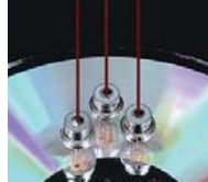
独自構造で長寿命化に成功した 半導体レーザー素子