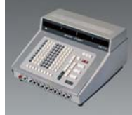
世界初、オールランジスタ・ダイ オードによる電子式卓上計算機 「コンペット」