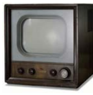
国産第1号テレビを量産