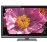
4原色3D液晶を採用した 「アコス クアトロN 3D」