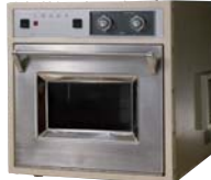
日本で初めて、電子レンジを量産