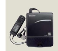
当時、世界最小・最軽量の 再生専用MDヘッドホンプレーヤー