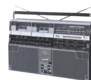
オリジナルテープづくりが楽しめる、 ダブルカセット・ラジカセ 「ザ・サーチャーW」