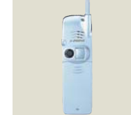
業界初、モバイルカメラ付き 携帯電話(J-フォン向け)