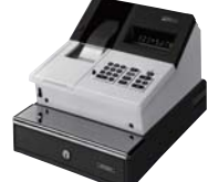
電池駆動の小型電子式 キャシュレジスタ