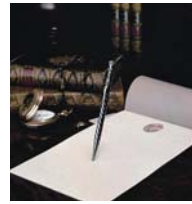
早川式繰出鉛筆 「シャープペンシル」