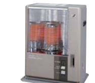
消火時の臭いを吸い取る吸臭装置 付き石油ストーブ「201(に・おん)」