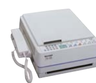
ファクシミリ・コピー・電話機の 一台三役のファクシミリ