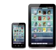
メディアタブレット「ガラバゴス」