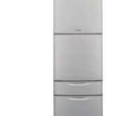
ノンフロン真空断熱材を採用した 冷蔵庫