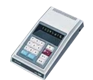
世界初、LSIを採用した電卓 「マイクロコンペット」