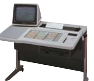
日本語ワードプロセッサ「書院」