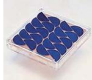
太陽電池標準ジュールを量産