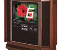
世界初、チャンネル数字が画面 に出るカラーテレビ、「デルサイン」