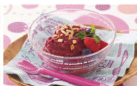
ミックスベリー&バナナ