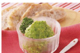
ブロッコリー&バナナ