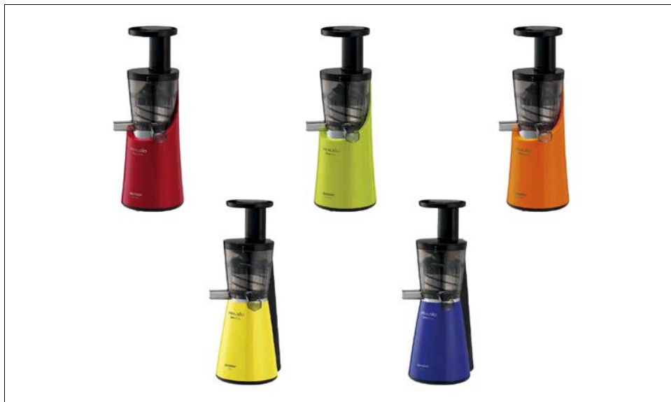
シャープ スロージューサー

当社が運営するSHARP i CLUB会員やいい暮らしストア会員様向けのサービス。新製品をご購入いただいたモニター様のご意見や感想を弊社にフィードバックしていただくことで、製品の開発やマーケティングに活用していく制度です。SHARP i CLUBおよびいい暮らしストアへの会員登録は無料です。