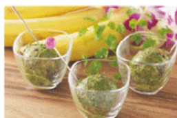
ほうれん草&バナナ &プルーン