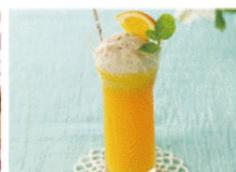
オレンジジュース +バナナフロースン