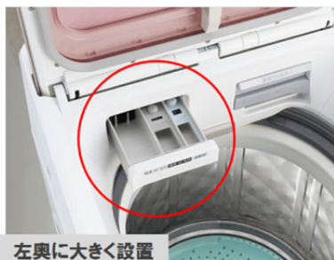
左奥に大きく設置