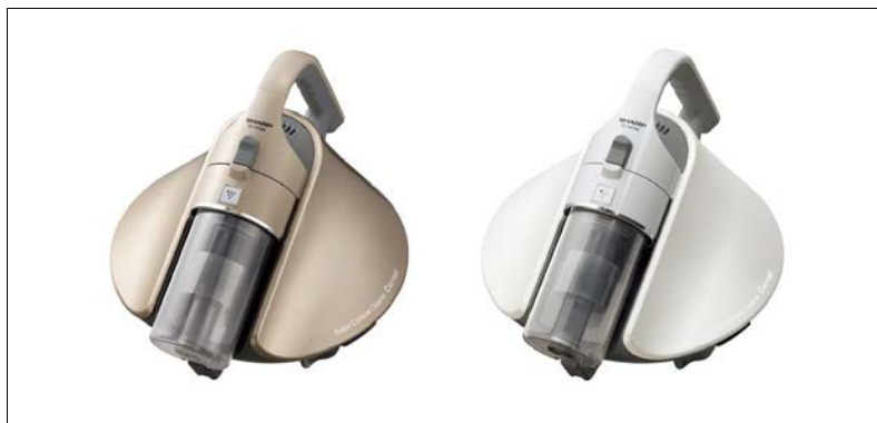
シャープ サイクロンふとん掃除機 Cornet (コロネ) <EC-HX150> 左から、-N(ゴールド系)、-W(ホワイト系)