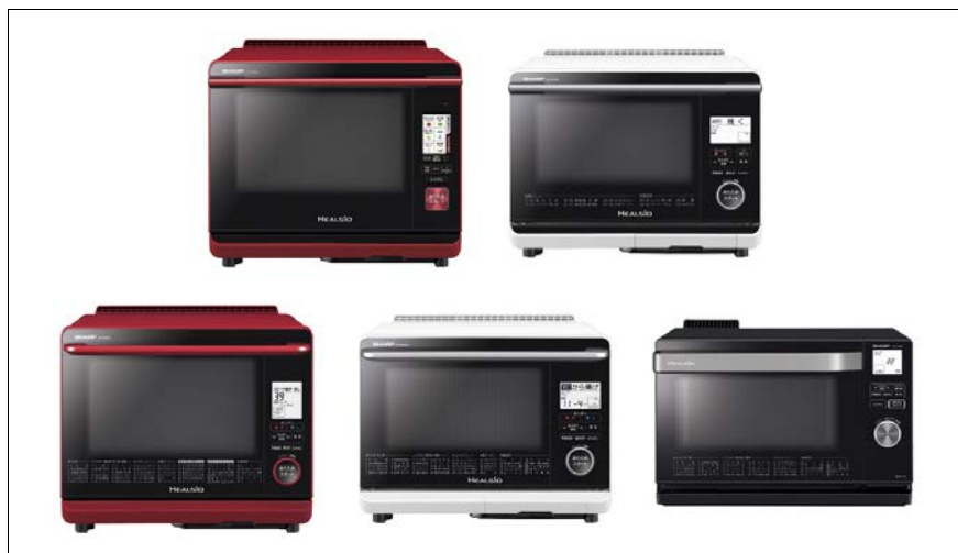
シャープ ウォーターオープン ヘルシオ

上段 左から <AX-XW300-R(レッド系)><AX-AP300-W(ホワイト系)> 下段 左から <AX-SP300-R(レッド系)><AX-MP300-W(ホワイト系)><AX-CA300-B(ブラック系)>