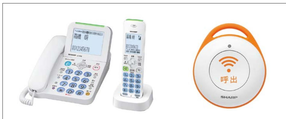
シャープ デジタルコードレス電話機/電話機用緊急呼出ボタン <左 : JD-AT82CL(ホワイト系) 右 : DZ-EC100(緊急呼出ボタン)> (<JD-AT82CW>は子機2台付き) (<JD-AT82CE>は子機1台と緊急呼出ボタン1台付き)

※10 使用環境25℃の場合。「緊急呼出ボタン」の使用状況によって使用時間は変わります。