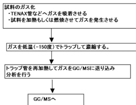
図2 試料のガス化フロー Fig. 2 Gasification flow of sample.

2004年度、当社解析技術センターに導入したGerstel社製加熱脱着システム(TDS2/CIS4)は個体から発生するガスを直接捕集してGC/MSでの分析が可能装置である。加熱部では-50℃から350℃まで任