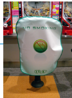
空気環境へのこだわりを感じさせる、禁煙がひと目でわかるシート。

「パチンコ店はタバコのニオイがつきもの」というイメージをプラズマクラスターイオンで変えていければと期待しています。店内の看板では、プラズマクラスターイオンの導入をアピール。アミューズメント業界の会合で、他店の方からプラズマクラスターイオンの効果について聞かれることもあります。先日は、県外の同業者が見学に来られました。実際のデータやお客さまの声など、できるだけ情報も提供し、さらに普及していくことを願っています。プラズマクラスターイオンで業界のイメージが高まるのであれば嬉しいことですから。