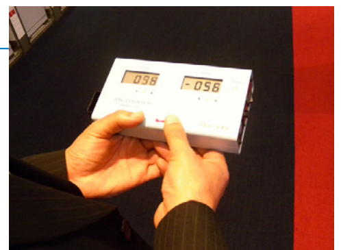
イオン濃度を定期的に測定

この店舗はパチンコ台が1200台もある大型店です。これだけ広いスペースに十分にプラズマクラスターイオンを行き渡らせるには、プラズマクラスターイオン発生機がどれくらい必要か。導入前にシャープに何度もシミュレーションしていただきました。その結果、天井の給排気口、57カ所に設置している現在の形になりました。でもプラズマクラスターイオン自体は目に見えないものなので、定期的にイオン濃度測定機で点検してもらっています。やはり、実際に数値で確認できることは、大きな安心材料ですね。