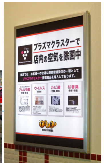
入口付近で、プラズマクラスターイオンをアピール