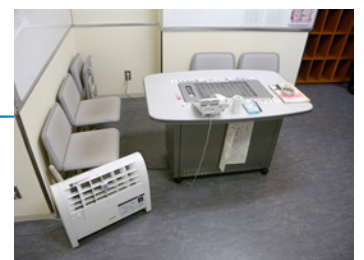
排煙テーブルのある喫煙室にも設置

バックヤードでは、据置型のプラズマクラスターイオン発生機も使っています。一度こんなことがありました。喫煙室に据置型を設置していたのですが、社員から、「排煙テーブルがあるから別にいらんんじゃないですか」と言われ、それもそうだと思い、外しました。でもすぐに、やっぱり戻してほしい！と(笑)。あるとないとではタバコのニオイが全然違ってたんです。プラズマクラスターイオン発生機の脱臭効果を改めて認識させられました。